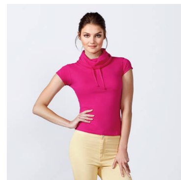
LAURUS WOMAN CA6645