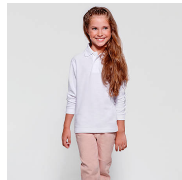
CARPE CHILD PO5008