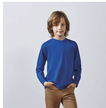
POINTER CHILD CA1205