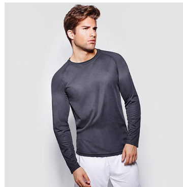
MONTECARLO L/S CA0415