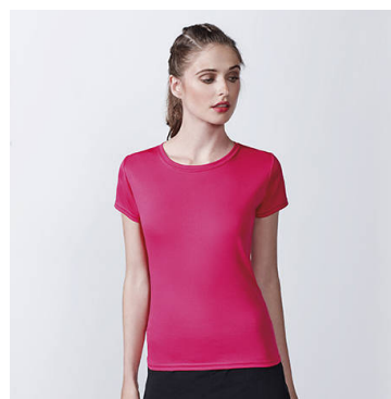
MONTECARLO WOMAN CA0423